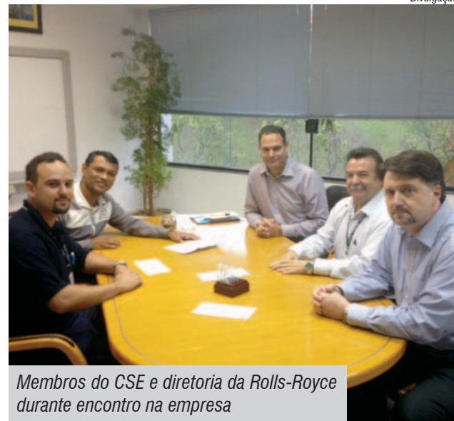
Membros do CSE e diretoria da Rolls-Royce durante encontro na empresa

é natural que participe do plano de manutenção de motores da aviação civil e militar por empresas nacionais como defende o Sindicato”, prosseguiu.